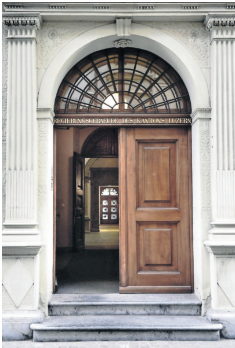
Das Regierungsgebäude des Kantons Zug.

Der Luzerner FDP-Grossstadtrat Daniel Wettstein über die Debatte um teure WCs. 20